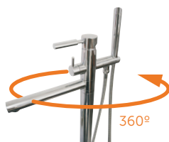
Cabeza giratoria Rotating head