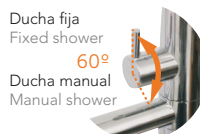
Control ducha fija/manual Manual/Fixed shower control