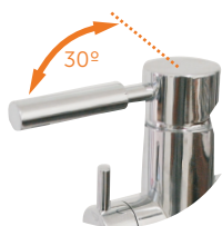
Control abierto/cerrado Open/close control